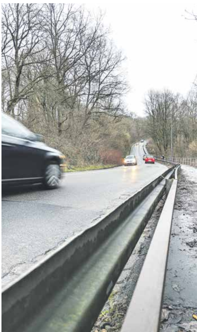
Die BV wünscht sich hier mehr Sicherheit – durch Tempo 30 und eine höhere Leitplanke.

An einem Schulweg könnte teilweise Tempo 30 kommen Im neuen Lärmaktionsplan ist das Teilstück der Lüttringhauser Straße von der Einmündung Kratzkopfstraße bis in die tiefste Stelle der Senke (am Fußweg zum Kottsiepen) als möglicher Tempo 30-Bereich ausgewiesen, auch eine Fahrbahnsanierung wird in Aussicht gestellt.