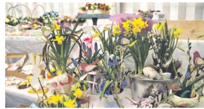
Farbenfrohe Ostergestecke und Dekorationen ergänzten das kulinarische Angebot.

die freundliche Beratung des kompetenten Meister Blumberg-Teams sorgten für glückliche Kunden und einen gelungenen Start in die Osterzeit.