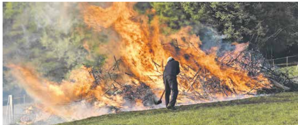
Zur Begrüßung des Frühlings wurde das Osterfeuer ins Leben gerufen, heute ist es vor allem ein geselliges Fest für die ganze Familie.

Das Kürzel XP steht für Christus und ist eines der ältesten Symbole für Christen – neben dem Kreuz und dem Fisch. Der Ursprung liegt im 2. Jahrhundert, als Christen es verwendeten, um ihren Glauben zu zeigen und um sich untereinander zu erkennen. Das XP, auch Christusmonogramm genannt, findet heute noch häufig auf Osterkerzen Verwendung.