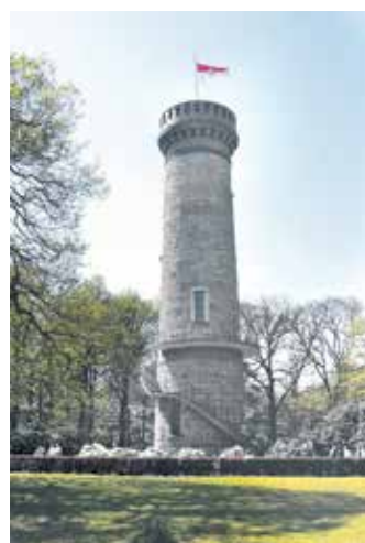
Der Toelleturm auf den Barmer Südhöhen.

Der 1888 erstmals geöffnete Toelleturm ist nach dem Unterbarmer Kaufmann Ludwig Ernst Toelle benannt, weil seine Familie