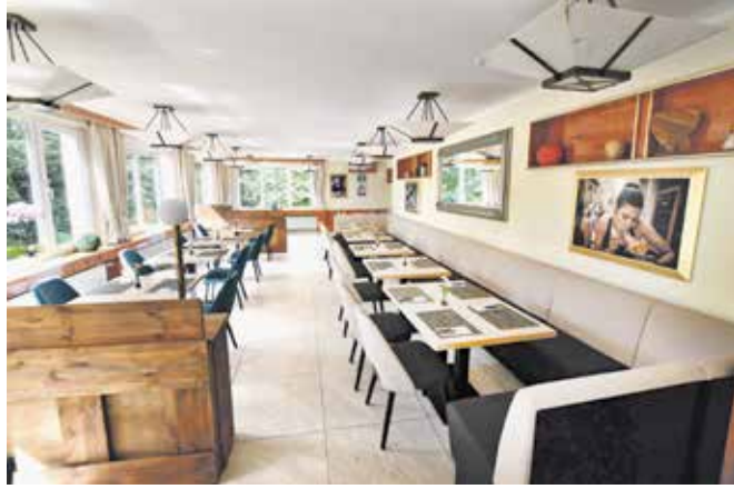
Mit gemütlichem Interieur lädt der Gastraum zum Speisen ein. Bis zu 70 Personen finden hier bei Feiern Platz.

Kontakt und Lieferservice: Tel. 01 79 / 61 82 408 Tel. 02 02 / 89 01 08 65 casusimone41@gmail.com