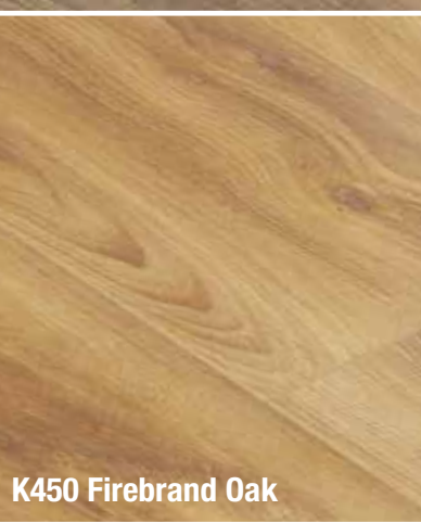
K450 Firebrand Oak

Fußeiste und Dämmung auch kostenlos dabei