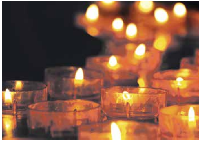
In der Nacht zu Ostersonntag erstrahlen viele Kirchen im Kerzenschein.

Die Terminierung für das Osterfest folgt festen Regeln. Das Datum ist von Jahr zu Jahr unterschiedlich. Im Zuge des ersten Konzils von Nicäa 325 wurde festgelegt, dass das christliche Osterfest am ersten Sonntag nach dem ersten Vollmond im Frühling stattfindet. Nach der Einführung des gregorianischen Kalenders 1582 feiern die Westkirchen an genau diesem genannten Sonntag Ostern. Die orthodoxen Kirchen weichen hier ab, da sie dem julianischen Kalender folgen.