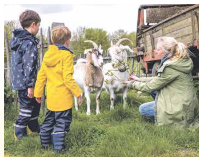
Auf dem 30 Hektar großen Gelände können Kinder die Tiere zum Beispiel auf einem historisch nachempfundenen Bauernhof erleben.

Bei der Teilnahme am Ferienprogramm liegt die Aufsichtspflicht bei den Erziehungsberechtigten oder erwachsenen Begleitpersonen des jeweiligen Kindes. Bei großer Nachfrage können bei einzelnen Mitmachprogrammen Wartezeiten entstehen.