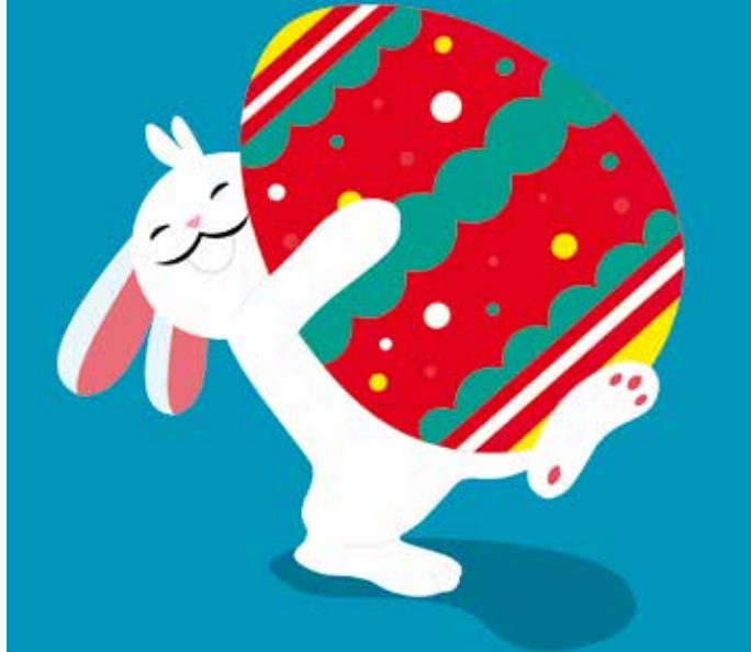
Hase und Ei sind wohl die bekanntesten Ostersymbole.

Fortsetzung von Seite 10 – mehr spannende Fakten zu Ostern.