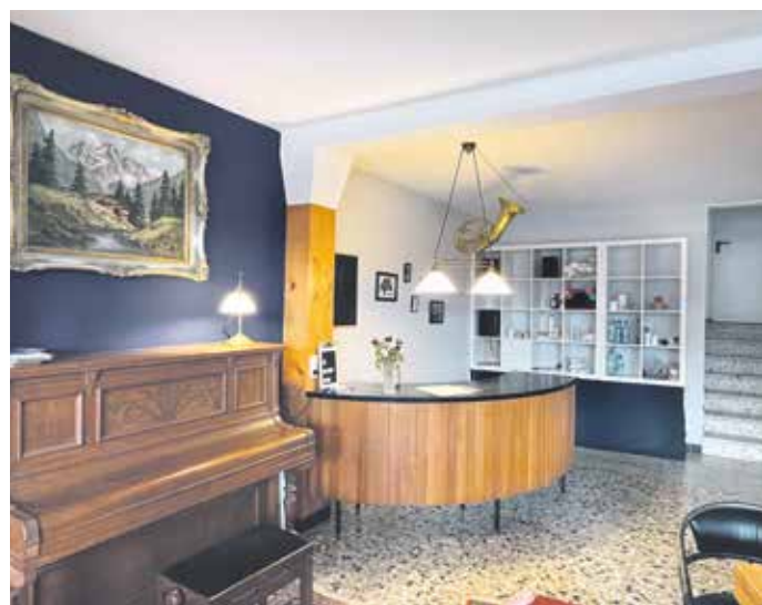
Ein ansprechendes Ambiente in den Räumlichkeiten in der Krim 12 lädt zum Treffen und Austausch ein.

Am 6. April ab 10 Uhr wird offiziell die Eröffnung des Vereins Freiraum Ronsdorf e.V., in der Krim 12, gefeiert.