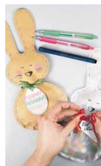
Ob für die Eiersuche oder als süße Geschenkverpackung: Über die Osterhasentüten freuen sich Jung und Alt.

Um die Hasentüten zu basteln, braucht man zunächst Pack- oder Transparentpapier, eine Nadel, einen stabilen Faden, einen Schleifenband, eine Schere, einen Locher und Kreativstifte wie den Finesliner Drawing Pen in Schwarz und den Gelschreiber G2-7, den es von Pilot in einer Auswahl von 31 bunten Farben gibt. Hinzu