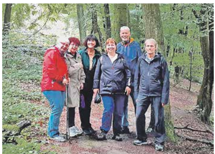
Ein Beispiel für gelungene Nachbarschaft: Gesundheitswandern mit „Wir in Hasseldelle e.V.“ in Solingen.

„Gesunde Nachbarschaften“ in Kooperation mit dem bundesweiten Netzwerk Nachbarschaft. Rund 200 Nachbarschaftsprojekte wurden seit 2020 nominiert und publik gemacht, mehr als 50 „gesunde Nachbarschaften“ bereits ausgezeichnet und prämiert. „Wir wollen mit diesem Förderpreis das wertvolle Engagement Freiwilliger stärken, die sich gemeinsam für die Gesundheit und Lebensqualität aller Generationen im Wohnumfeld einsetzen“, sagt Günter Wältermann, Vorstandsvorsitzender der AOK Rheinland/Hamburg.