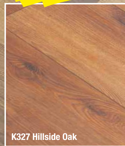
K327 Hillside Oak

Riesige Auswahl an Laminat, Vinylböden, Parkett und Bioböden – über 1.000.000 m 2 immer verfügbar im Logistikzentrum.