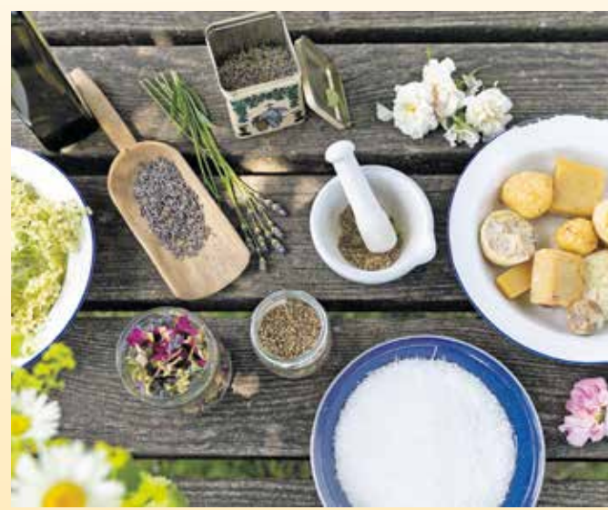
In der Seifenwerkstatt entstehen aus heimischen Kräutern, verschiedenen Ölen und wohlriechenden Seifenflocken selbst gemachte Seifenstücke.